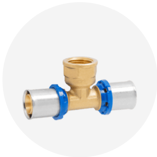
ART. APL 21 TEE FEMMINA