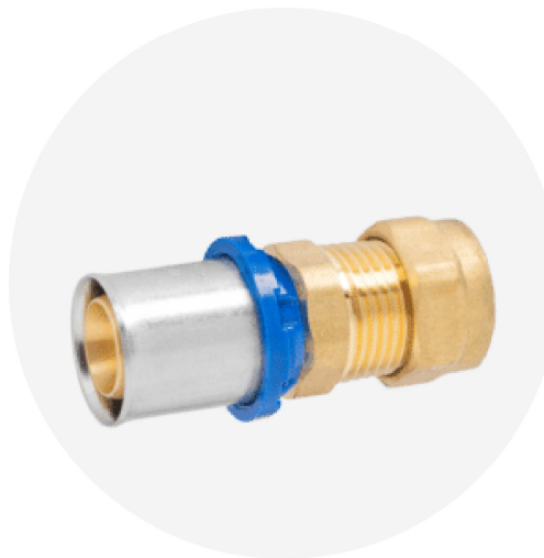
ART. APL 14 RACCORDO DI TRANSIZIONE MULTISTRATO-RAME A STRIGERE